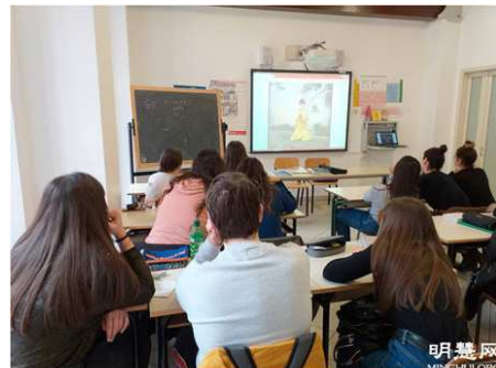
▲上图：课堂上学生们认真观看师父教功视频。↓下图：高中生们正在学炼第五套功法-打坐。

今年的5月13日是世界法轮大法日，高中的学生们也真诚地双手合十，感激法轮大法师父将大法传给世界，使他们能听闻并受益于大法的美好！他们真诚地恭祝师父生日快乐！并祝贺世界法轮大法日！ ◇