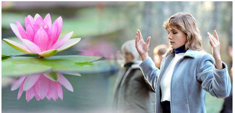
法轮功第二套功法演示

他说：“我们当初那么为共产党卖力，现在却成了共产党要清除的‘害群之马’。你说讽刺不讽刺？”◇