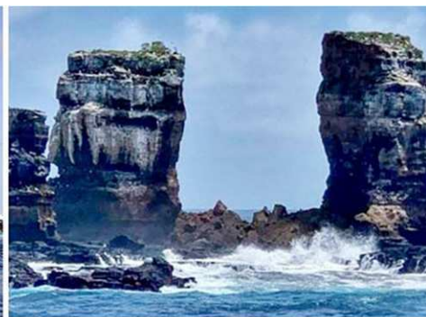
▲二零二一年五月十七日，厄瓜多尔环境部公布：“达尔文拱门”崩塌。左图是坍塌前的拱门。右图显示，该拱门仅剩下两根柱子。